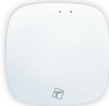
Bezprzewodowa inteligentna bramka TSH B100