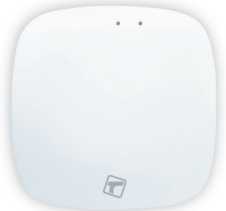
Inteligentna bramka TSH B100 ZIGBEE